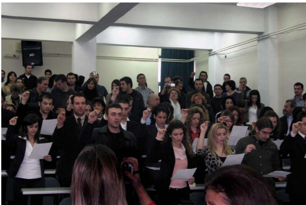
Πρόσφατη ορκωμοσία σπουδαστών του Τμήματος.