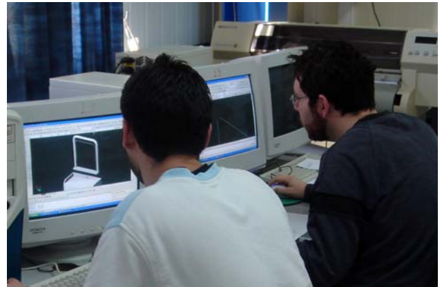
Μερική άποψη διδασκαλίας μαθημάτων Τεχνικού Σχεδίου και Σχεδιασμού Επίπλων με Η/Υ.