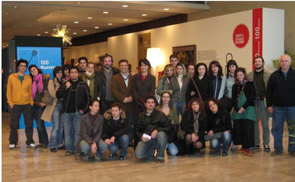
Εκπαιδευτική επίσκεψη των σπουδαστών σε έκθεση DESIGN.