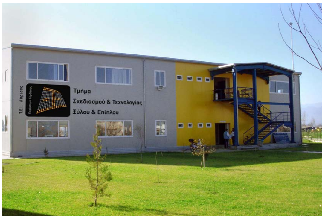
Το νέο κτίριο του Τμήματος στην Καρδίτσα.