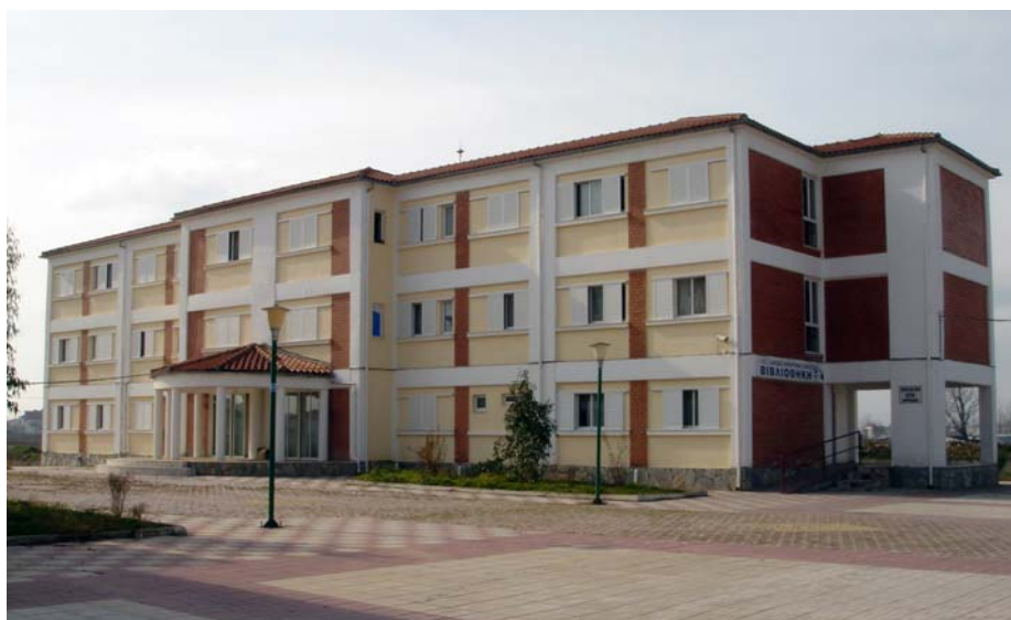
Το κτίριο των σπουδαστικών εστιών.