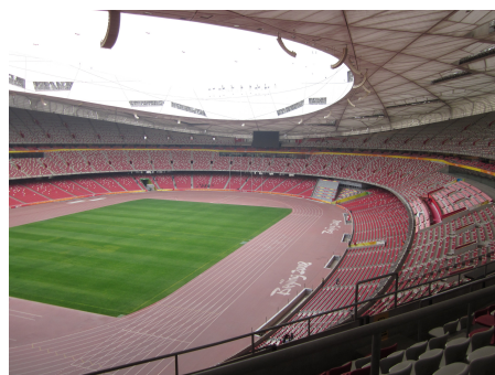
Φωτογραφίες από την επίσκεψη στο Ολυμπιακό Στάδιο του Πεκίνου όπου έγιναν οι αγώνες στίβου, Ολυμπιακοί 2008 (7/11/2011). Εξαιρετική χαλύβδινη κατασκευή!

Το βράδυ φιλοξενηθήκαμε σε κλασικό, κινέζικο εστιατόριο στο κέντρο του Πεκίνου.