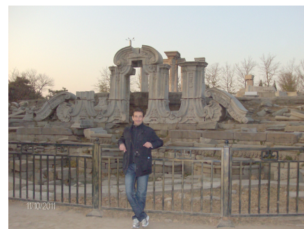
Φωτογραφίες από την επίσκεψή μας στο Yuanmingyuan Palace (10/11/2011)

Το απόγευμα της Πέμπτης έγινε ο αποχαιρετισμός με τους συναδέλφους-καθηγητές του Τμήματος αυτού και ανανεώθηκε το ραντεβού μας, για την Ελλάδα, στο προσεχές μέλλον.