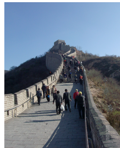
Αναμνηστικές φωτογραφίες από την επίσκεψη στο Σινικό Τείχος (9/11/2011)