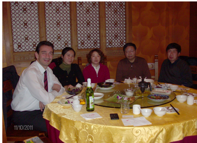
Φωτογραφίες από τις διαλέξεις της 10/11/2011, παρουσία των μεταπτυχιακών φοιτητών του εν λόγω Τμήματος, (κάτω δεξιά): φωτογραφία από το γεύμα εργασίας που μας παρατέθηκε

Το Τμήμα του Πανεπιστημίου BJFU είναι ακαδημαϊκά ένα πανεπιστημιακής εκπαίδευσης τμήμα -όχι τεχνολογικής κατεύθυνσης- το οποίο καλύπτει κυρίως θεωρητικά γνωστικά πεδία της επιστήμης ξύλου , ενώ διαπιστώθηκε ότι δεν έχει συνεργασίες με τις βιομηχανίες ξύλου της Κίνας ούτε διεξάγει εφαρμοσμένη έρευνα . Επίσης, ο Τομέας Σχεδιασμού Επίπλου είναι σε επίπεδο παροχής θεωρητικής γνώσης, με σύγχρονα συστήματα ηλεκτρονικής σχεδίασης αλλά χωρίς εργαστήρια κατασκευής επίπλων/αντικειμένων ούτε και υλοποίησης έργων ή projects ( πρωτοτύπων ), το οποίο και σημειώθηκε ως αδυναμία από την Dr. Fan. Στο πεδίο του σχεδιασμού επίπλου υπάρχουν δυνατότητες συνεργασίας και προσέλκυσης φοιτητών με δυνατότητα (εάν αποδεχτεί το ΤΕΙ/Λ) προγραμμάτων bachelor 2+2 ετών, στο κάθε ίδρυμα. Ο τομέας της επιστήμης-τεχνολογίας ξύλου στεγάζεται σε ένα κτίριο σχετικά παλιό, με πεπαλαιωμένο εξοπλισμό πλην εξαιρέσεων. Επίσης υπάρχει στενότητα στους χώρους των εργαστηρίων του. Εκλείπει ο σύγχρονος ηλεκτρονικός εξοπλισμός θα λέγαμε, ειδικά σε τεχνικές αναλυτικής χημείας για ένα τέτοιο θεωρητικό τμήμα ΑΕΙ. Το Εργαστήριο που επισκεφτήκαμε επικεντρώνεται στην εκπαίδευση και την έρευνα σε θέματα προστασίας και εμποτισμού του ξύλου, τεχνικών βελτίωσης των ανθυγροσκοπικών ιδιοτήτων με συμβατικές τεχνολογίες αλλά -πρόσφατα- και με τεχνικές нанοτεχνολογίας . Σε αυτό εργάζονται 7 μεταπτυχιακοί φοιτητές και 2 διδακτορικοί φοιτητές. Υπεύθυνη είναι η Prof. J. Cao.