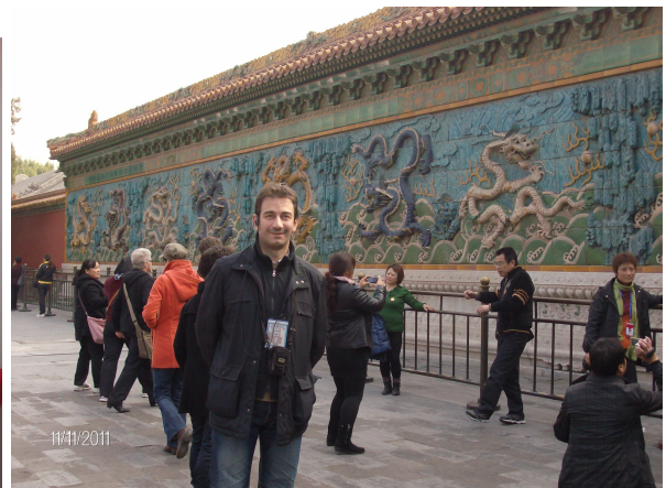
Φωτογραφίες της 11/11/2011, από την επίσκεψη στο ιστορικό κέντρο του Πεκίνου!

Η επιστροφή μας έγινε κανονικά το Σάββατο 12/11/2011, διά της Φρανκφούρτης, χωρίς κανένα πρόβλημα αλλά με ταξίδι μακρινό και βέβαια αρκετά κουραστικό , που ήταν ωστόσο μια υπέροχη εμπειρία!