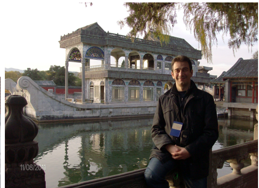
Φωτογραφίες από την επίσκεψη στο Summer Palace του Πεκίνου.

Τετάρτη 9/11/2011 Το πρωί μας περίμενε μισθωμένο αυτοκίνητο του Πανεπιστημίου για ένα ωραίο ταξίδι, μοναδικό όπως λένε οι Κινέζοι και προορισμός ζωής, στο Great Wall (Σινικό Τείχος) που απέχει περίπου 180 χλμ. από το Πεκίνο. Φτάσαμε εκεί, στην περιοχή Mandarin όπου είναι και το πιο φημισμένο site και ξεναγηθήκαμε για περίπου 2 ώρες. « He who does not reach the Great Wall, is not a true man », αναφέρει μια Κινέζικη παροιμία!