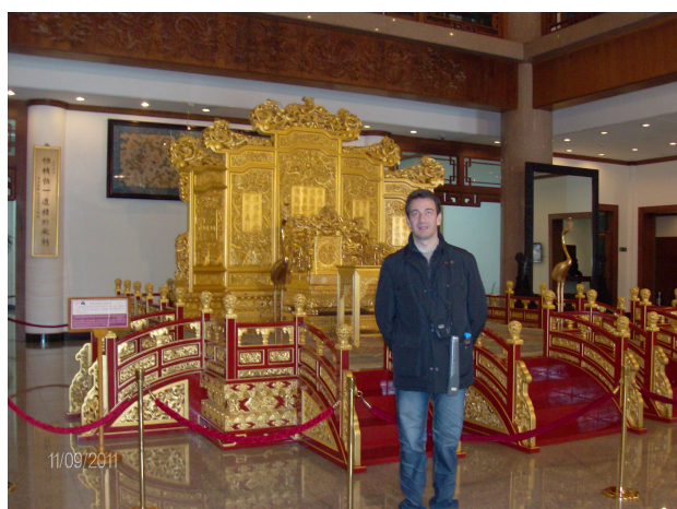
Φωτογραφίες από την επίσκεψή μας στο China Red Sandalwood Μουσείο της Κίνας (9/11/2011)