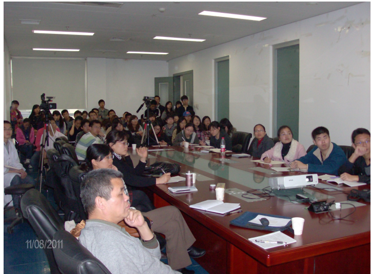
Φωτογραφίες από τις διαλέξεις της 8/11/2011, παρουσία των μεταπτυχιακών φοιτητών του εν λόγω Τμήματος, (κάτω αριστερά): συνομιλία με τον Dean της Σχολής Prof. Run-Cang Sun

Έγιναν πολλές ερωτήσεις από τους φοιτητές, ενώ επίσης στο περιθώριο των διαλέξεων συζητήθηκαν με τον Dean Prof. Sun, οι δυνατότητες ανταλλαγής φοιτητών και καθηγητών και η περαιτέρω συνεργασία των δύο τμημάτων μας.