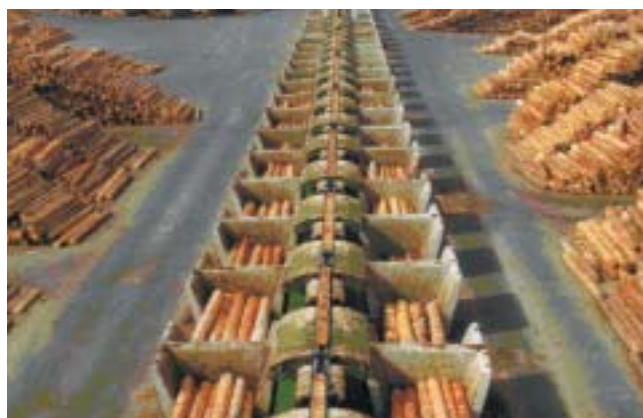
Μεταφορά τροπικής ξυλείας από το δάσος στην αγορά.