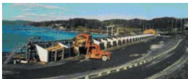
Αποθήκευση κορμών σε λίμνη και ταξινόμηση κορμών στην κορμπολατεία.