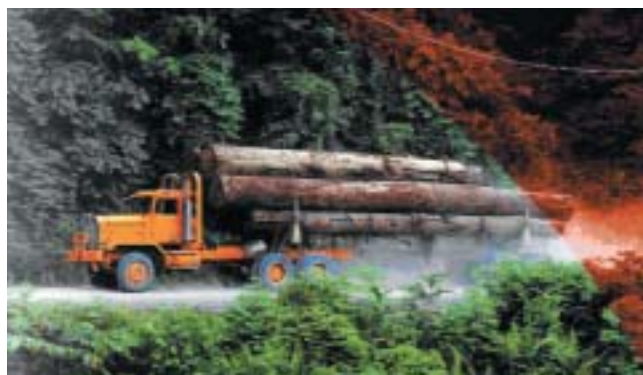
Μεταφορά τροπικής ξυλείας από το δάσος στην αγορά.

Χρησιμοποιείται στην κατασκευή επίπλων, στην παρα-