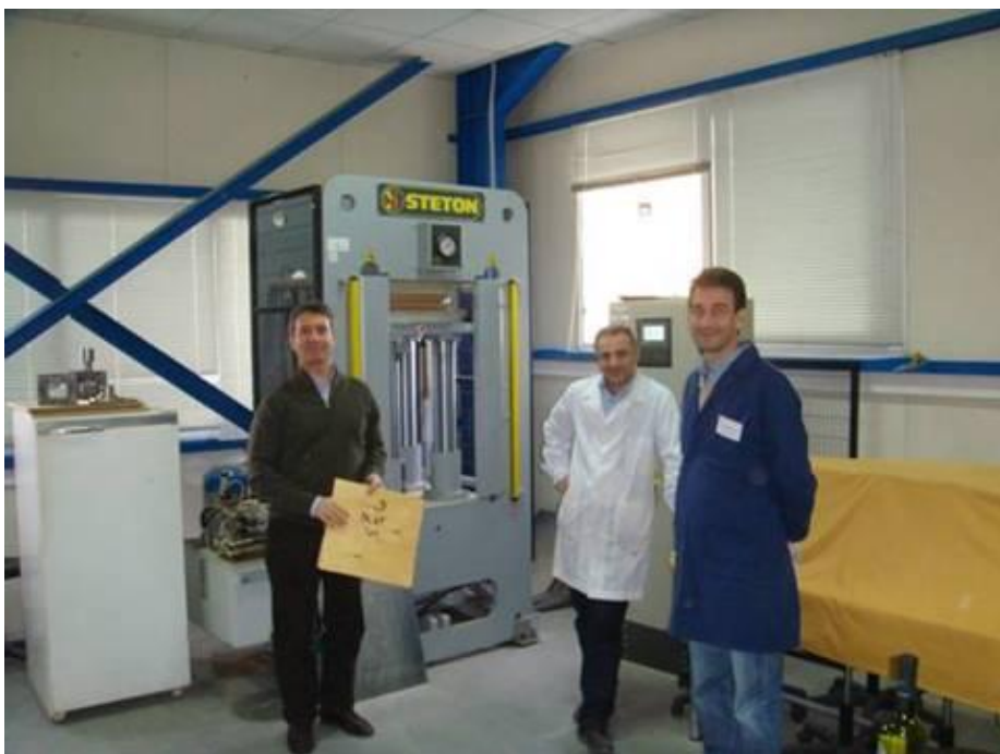
Εργαστηριακή δοκιμή παραγωγής κόντρα-πλακέ στη θερμή πρέσα (πίσω)