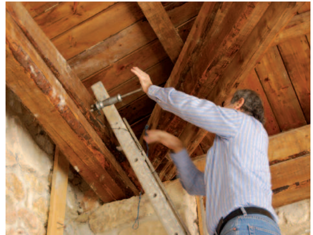
Η μέτρηση της υγρασίας της ξυλείας μπορεί να γίνει και εκ των υστέρων, με χρήση ηλεκτρικού υγρασιόμετρου. Το ορθό όμως είναι η ξυλεία να είναι ήδη ξηραμένη, πριν να χρησιμοποιηθεί.

της κατασκευή για τα ελληνικά δεδομένα, παρότι σε άλλες χώρες χρησιμοποιείται αρκετά, με δικτυώματα κατασκευαζόμενα επιτόπου ή με προκατασκευασμένα δικτυώματα.