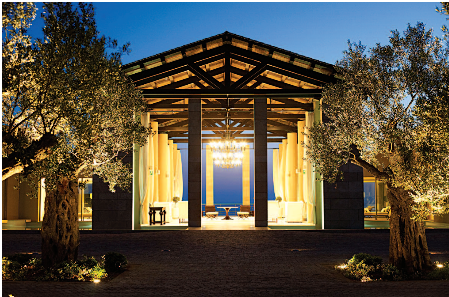
Ξύλινα εμφανή ζευκτά στο ξενοδοχείο "Costa Navarino" στη Μεσοσηία. Αρχιτεκτονική μελέτη: Μελετητική - Γραφείο Μελετών Αλέξανδρου Ν. Τομπάζη Ε.Π.Ε.

Η ξυλεία κωνοφόρων (κυρίως ελάτης) χρησιμοποιείται και για την πεταύρωση («σανίδωμα, πέτσωμα») της στέγης. Παλαιότερα χρησιμοποιούνταν κυρίως ξυλεία λεπτού πάχους, περίπου 12 mm («σκουρέτο»), ενώ σήμερα χρησιμοποιείται περισσότερο ημισανίδα πάχους 18 mm («μισόταβλα») ή σανίδα 24 mm («τάβλα»).