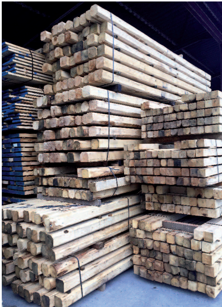
Τράβα καστανιάς εισαγωγής, επεξεργασμένη.

Η στέγη με ξύλινα δικτυώματα δεν είναι συνη-