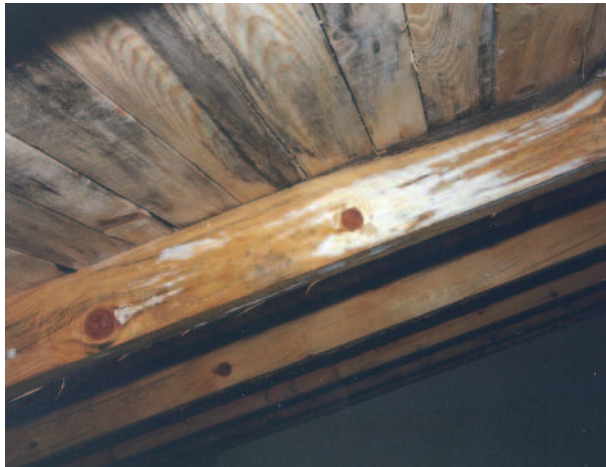
Στέγη κατασκευασμένη με "χλωρή" εγχώρια ξυλεία πεύκης σε δημόσιο κτίριο. Η μέτρηση της υγρασίας του ξύλου έδειξε τιμές 17% - 22%, δύο μήνες μετά την τοποθέτηση. Επιφανειακά αναπτύχθηκαν γρήγορα μυκτλια και μεταχρωματισμοί. Εφόσον δεν υπάρχει εξωτερική είσοδος υγρασίας και γίνεται ένας στοιχειώδης εξαερισμός στο χώρο της στέγης, το πρόβλημα θα υποχωρήσει. Η υγρασία όμως δεν θα έπρεπε να ήταν υψηλή. Η ενδειγμένη αρχική υγρασία της ξυλείας πρέπει να είναι 12% - 16%.