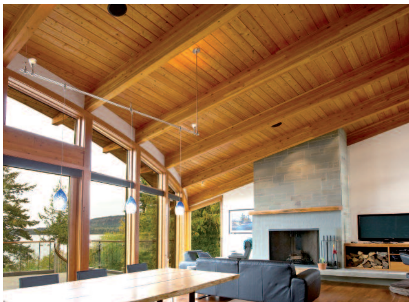
Κατασκευή εμφανούς στέγης με επικολητή ξυλεία σε κατοικία.

Τα τελευταία χρόνια χρησιμοποιούνται πολύ και επιφάνειες από ξυλόπλακες προσανατολισμένων ξυλοτεμαχιδίων, γνωστών ως OSB. Το OSB πρέπει να είναι κλάσης 3 (OSB/3), δηλ. συγκολλημένο με ρητίνες υψηλής αντοχής στην υγρασία (PF ή PMDI). Σε πιο ποιοτικές και πιο ακριβές κατασκευές η πεταύρωση γίνεται και με επιφάνειες αντικολλητών (φύλλων κόντρα πλακέ) καλής ποιότητας (κόντρα πλακέ θαλάσσης), συγκολλημένων με φαινολικές ρητίνες (PF). Η χρήση φύλλων OSB ή κόντρα πλακέ μειώνει το χρόνο κατασκευής και ενισχύει σημαντικά τη διαφραγματική λειτουργία της πεταύρωσης. Επάνω από την πεταύρωση (μετά από τη στεγανοποιητική μεμβράνη) τοποθετούνται οι τεγίδες και επιτεγίδες, επίσης από ξυλεία κωνοφόρων και στις διατομές που αναφέρθηκαν, προκειμένου να εξυπηρετήσουν τον αερισμό της στέγης, την (πιθανή) τοποθέτηση θερμομόνωσης και φυσικά τη στερέωση