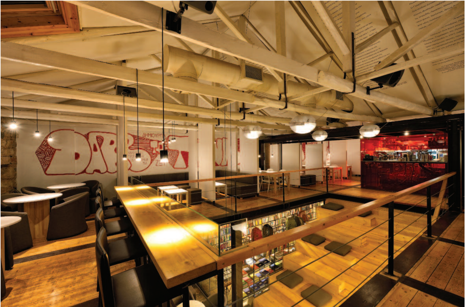
Ξύλινα ζευκτά στη στέγη βιβλιοπωλείο - αναγνωστηρίου στην Πάτρα, αρχιτεκτονική μελέτη: Μυρτώ Κιούρτη.