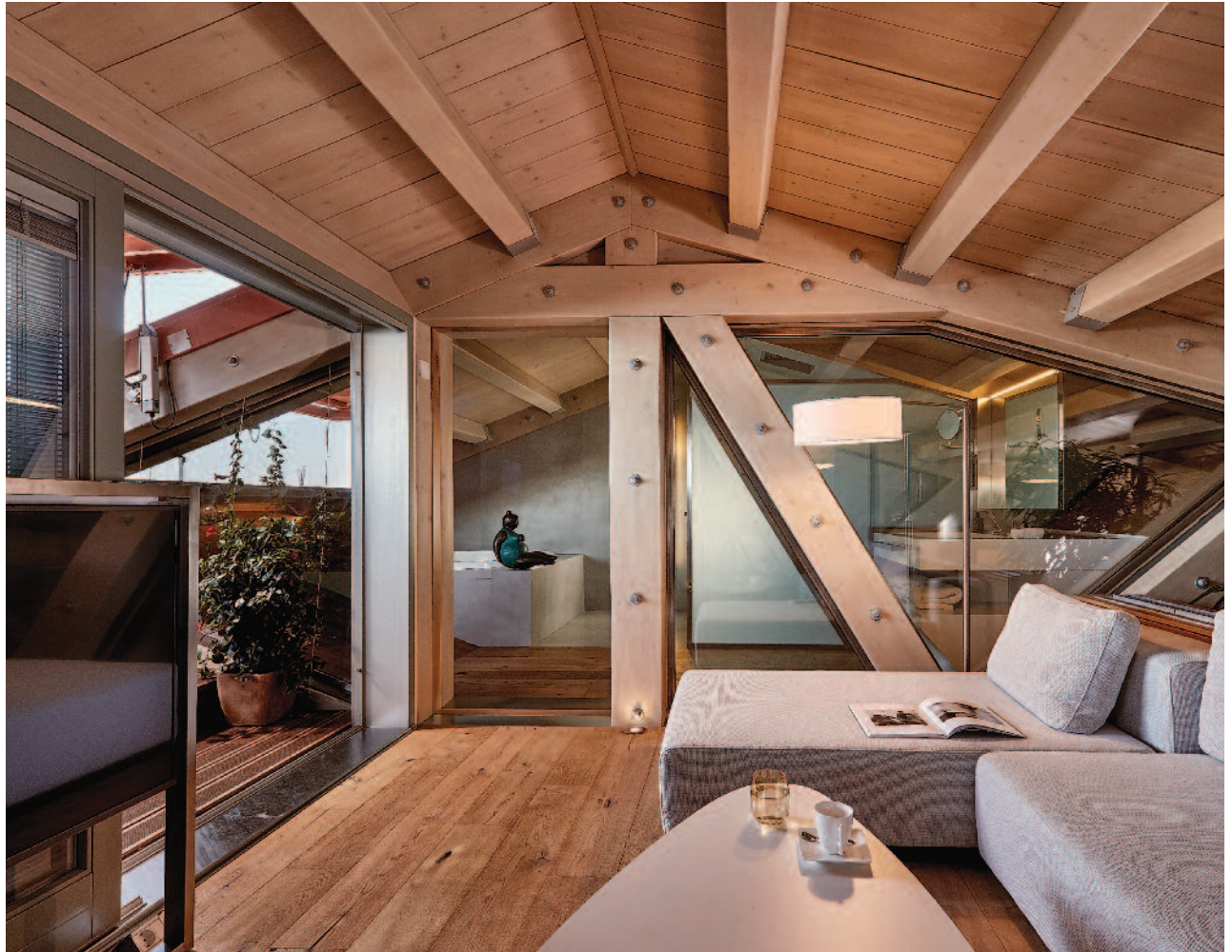
Διαμόρφωση σοφίτας σε ένα ιδιαίτερο διαμέρισμα δύο επιπέδων, χρησιμοποιώντας ως κύριο χωρικό καταλύτη τα σύνθετα ζευκτά της οροφής. Ξενοδοχείο "Domus Renier" στην Παλαιά Πόλη Χανίων, αρχιτεκτονική μελέτη: Αριστομένης Βαρουδάκης, Πιώργος Βαρουδάκης.

παραμένει το αισθητά μικρότερο βάρος της ξύλινης στέγης, κι αυτό δίνει τη δυνατότητα για μικρότερες διατομές στα φέροντα στοιχεία της οικοδομής, επομένως και μικρότερα συνολικά κόστη κατασκευής. Ακόμη όμως και με ύπαρξη πλάκας σκυροδέματος, η ξύλινη στέγη συνεισφέρει στη θερμομόνωση του κτιρίου, καθώς το ξύλο ως υλικό έχει μικρό συντελεστή θερμικής αγωγιμότητας (λ).