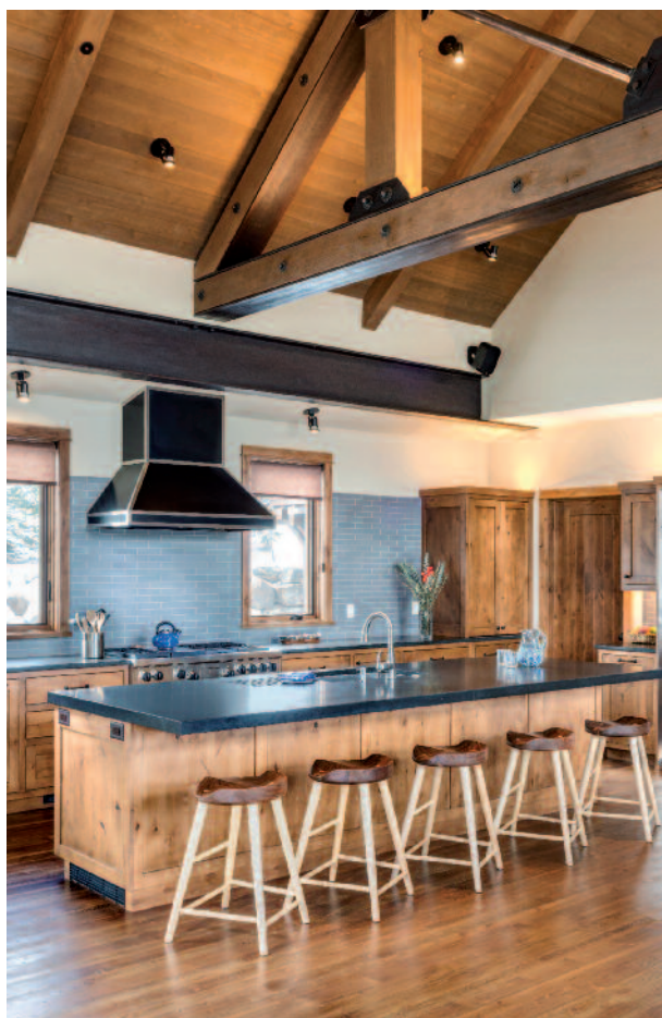
Στέγη με ξύλινα ζευκτά και χρήση μεταλλικών ελασμάτων.

Πελεκητή λέγεται η απλάνιστη ξυλεία που έχει διατομές 80 x 100, 100 x 100, 100 x 120, 120 x 120, 120 x 150, 150 x 150, 180 x 180, 200 x 200 (mm) με μήκη από 3 έως 12 m, από τα είδη ερυθρελάτης (spruce), έλατο, και καστανιά, κυρίως Αγίου Όρους και Πηλίου, που χρησιμοποιείται σε στέγες, καθώς και σε υπόστεγα ή πέργκολες. Η πελεκητή ξυλεία έλκει το όνομά της από το γεγονός ότι στο παρελθόν η βασική κατεργασία των κορμών (προκειμένου από σχήμα κόλουρου κώνου να αποκτήσουν πρισματικό σχήμα) γινόταν χειρωνακτικά με ειδικό τύπο τσεκουριού, την "πελέκα". Υπήρχε μάλιστα και σχετική εξειδίκευση στους υλοτόμους: ο "πελεκάνος". Σε πολλές παλαιές στέγες συναντάται και σήμερα ξυλεία καθαρά πελεκητή, στην οποία φαίνονται οι τομές του τσεκουριού. Η πελεκητή ξυλεία στο ένα άκρο της (το λεπτότερο του κορμού) πολλές φορές έχει λίγο μικρότερη διατομή και "λειψάδες" στις ακμές της. Η εισαγόμενη λεπτή πελεκητή ξυλεία με ελλειπείς ακμές στην ελληνική αγορά αποκαλείται και "τράβα", καθώς επικράτησε το όνομα της κυρίαρχης στο παρελθόν εισαγόμενης φέρμας (TRAVA). Η πελεκητή ξυλεία ερυθρελάτης περιέχει μεγάλο ποσοστό εντεριώνης (ανώριμου ξύλου), οπότε έχει χαμηλή συνήθως κλάση μηχανικής αντοχής (C18). Σήμερα αυτή η ξυλεία