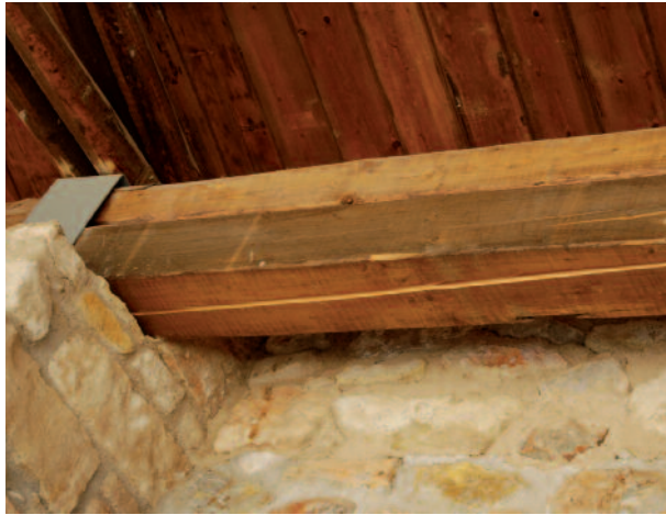
Μεγάλες διαμήκειες ραγδώσεις σε δοκούς από ξυλεία ερυθρελάτης λόγω υψηλής αρχικής υγρασίας.