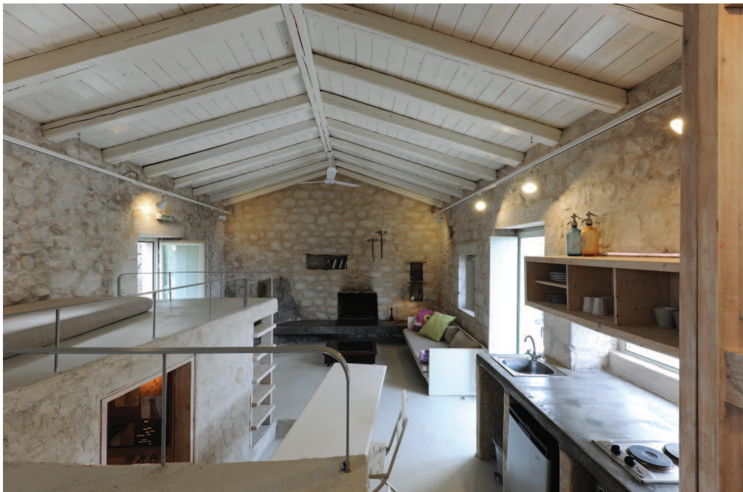
Στέγη με καβαλάρη και στοιχεία από πελεκητή ξυλεία. Αναστήλωση μανιτικού πυργόσπιτου, αρχιτεκτονική μελέτη / επίβλεψη: Έλενα Ζερβουδάκη, Εταιρεία z-level