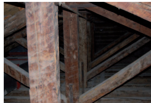
Πελεκητή ξυλεία πεύκης στη στέγη του κτιρίου Weiler (περιοχή Μακρυγιάννη, Αθήνα, 1835). Η στέγη λειτουργεί κανονικά, δύο αιώνες τώρα, με μικρή έκτασης επισκευές στα σημεία που προσλάμβανε υγρασία.

Γι' αυτούς τους λόγους είναι ορθό η χρησιμοποιούμενη ξυλεία (ζευκτά, πεταύρωση, τεγίδες) να έχει υποστεί ένα προληπτικό, προστατευτικό εμπότισμό. Η χρήση ξυλείας εμποτισμένης με άλατα βορίου & χαλκού είναι μια άριστη λύση με πολύ μικρή οικονομική επιβάρυνση: προκαλεί εφ' όρου ζωής προστασία της ξυλείας της στέγης. Επειδή προσδίδει ένα ελαφρό (πρασινωπό) χρωματισμό στην ξυλεία, δεν ενδείκνυται για εμφανείς στέγες. Σ' αυτή την περίπτωση η λύση είναι η επίλειψη της ξυλείας με βερνίκια εμπότισμού. Η τιμή της εμποτισμένης ξυλείας εγχώριου πεύκου (σκεπόξυλου), που συνιστάται για χρήση σήμερα, κυμαίνεται γύρω στα 360-380 €/m 3 .