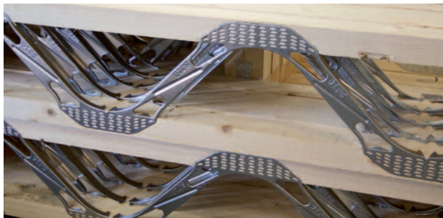
Δικτύωμα κατασκευασμένο επιτόπου με ξυλεία και επιθεματικά μεταλλικά στοιχεία.