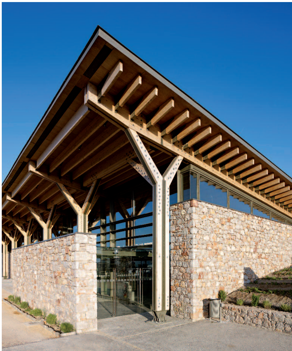
Μουσείο Μαστίγας Χίου. Ο φέρων οργανισμός των κεκλιμένων ξύλινων στεγών είναι από συγκολλητή ξυλεία ποιότητας GL32. Οι κύριοι φορείς είναι δίδυμοι και στηρίζονται αρθρωτά σε ξύλινα δενδροειδή υποστυλώματα στο βόρειο άκρο τους. Αρχιτεκτονική και μουσειογραφική μελέτη: Γραφείο Κίζη Α.Ε.

Στα προστατευτικά μέτρα θα πρέπει να συμπεριληφθεί απαραίτητα και η απαραίτητη θερμομόνωση μιας καμινάδας τζακιού ή λεβητοστασίου, εφόσον αυτή διέρχεται μέσα από ξύλινη στέγη.