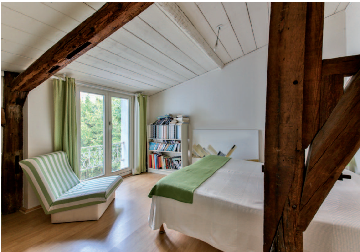
Η χρήση ξυλείας προστατευμένης με κατάλληλα σκευάσματα προφυλάσσει το ξύλο κυρίως από μύκητες και έντομα.

λείας και η στέγη γίνεται επικίνδυνη, ειδικά αν οι διατομές δεν είναι επαρκείς. Αυτά τα θέματα αντιμετωπίζονται σήμερα, εφόσον γίνεται ορθή εφαρμογή του ευρωκώδικα 5. Σύμφωνα μ' αυτόν και κατ' εφαρμογή του προτύπου EN 14081, όπως προβλέπεται, η δομική ξυλεία πρέπει να είναι πιστοποιημένης μηχανικής αντοχής, όπως έχει προδιαγράψει η μελέτη της στέγης.