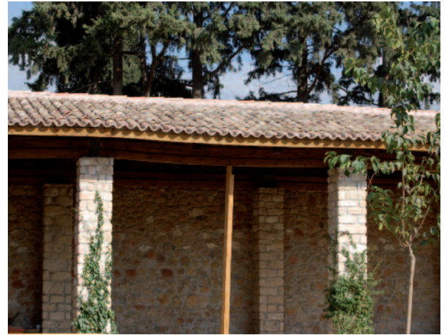
Ο συνδυασμός ακατάλληλης διατομής ξυλείας με εντεριών και υψηλής υγρασίας ξύλου οδήγησε γρήγορα σε παραμόρφωση της δοκού. Τοποθετήθηκαν εκτάκτως ξύλινα υποστυλώματα.