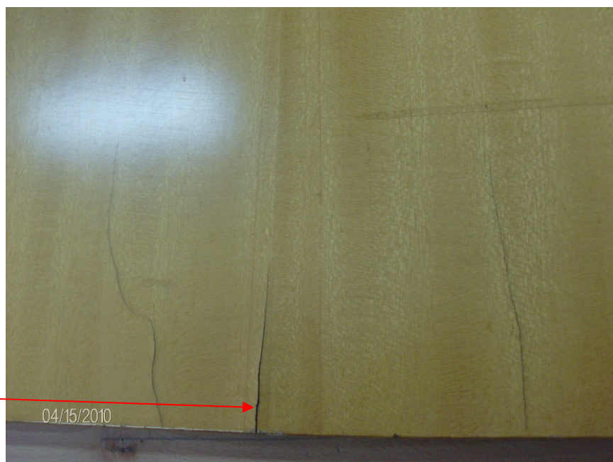
Εικ. 1. Ξυλεπιφάνεια φινιρισμένη με «πολυεστέρα»

Το ξύλο αποτέλεσε και αποτελεί εξαιρετική πρώτη ύλη για την κατασκευή επίπλων. Ωστόσο, θα πρέπει να έχει ξηραθεί πολύ καλά και ως υλικό που συνεχώς «αναπνέει» θα πρέπει, πριν χρησιμοποιηθεί σε εσωτερικές κατασκευές (δηλ. στεγασμένες και με θέρμανση το χειμώνα) να έχει περιεχόμενη υγρασία περίπου στο 8%. Αυτό αποτελεί μια απαραίτητη προϋπόθεση για την άριστη χρήση του π.χ. σε έπιπλα εσωτερικού χώρου.