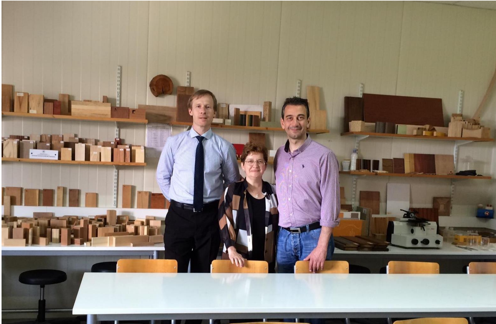
Ενάγηση – επίσκεψη σε χώρο του εργαστηρίου, κατά την οποία συζητήθηκαν ευρέως θέματα κοινού ενδιαφέροντος.