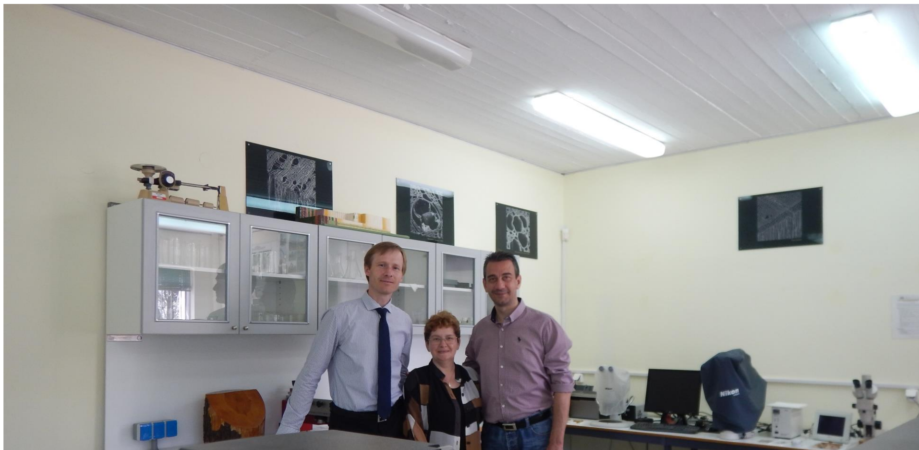
Με τους συναδέλφους, κατά την ξενάγηση στο εργαστήριο του τμήματος (χώρος μικροτόμου, και μικροσκοπικής παρατήρησης και μελέτης δειγμάτων ξύλου – βλ. τμήμα ανατομίας ξύλου).