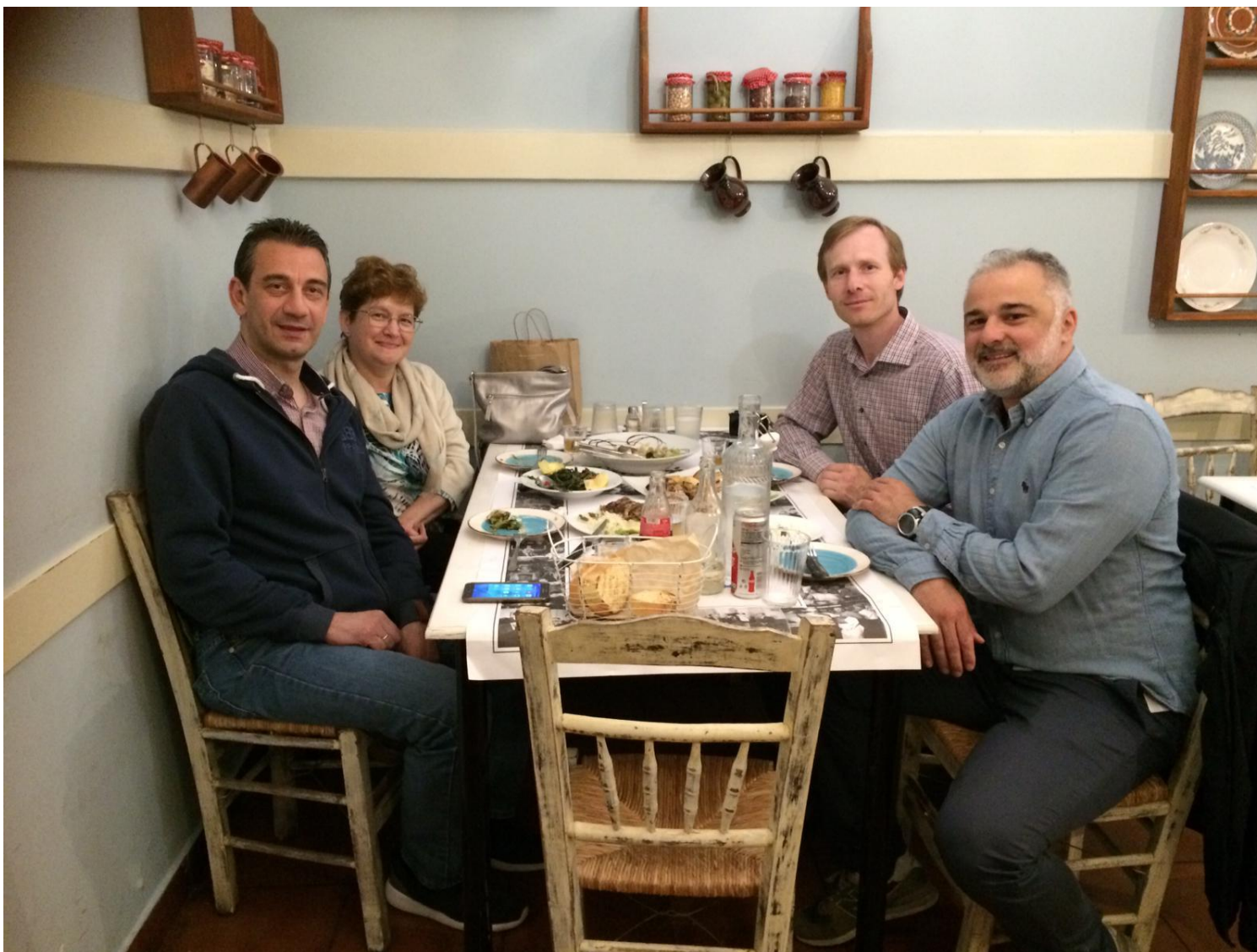
Αναμνηστική φωτογραφία από το δείπνο εργασίας - μαζί με τους επισκέπτες / καθηγητές την 1 η ημέρα της επίσκεψης.