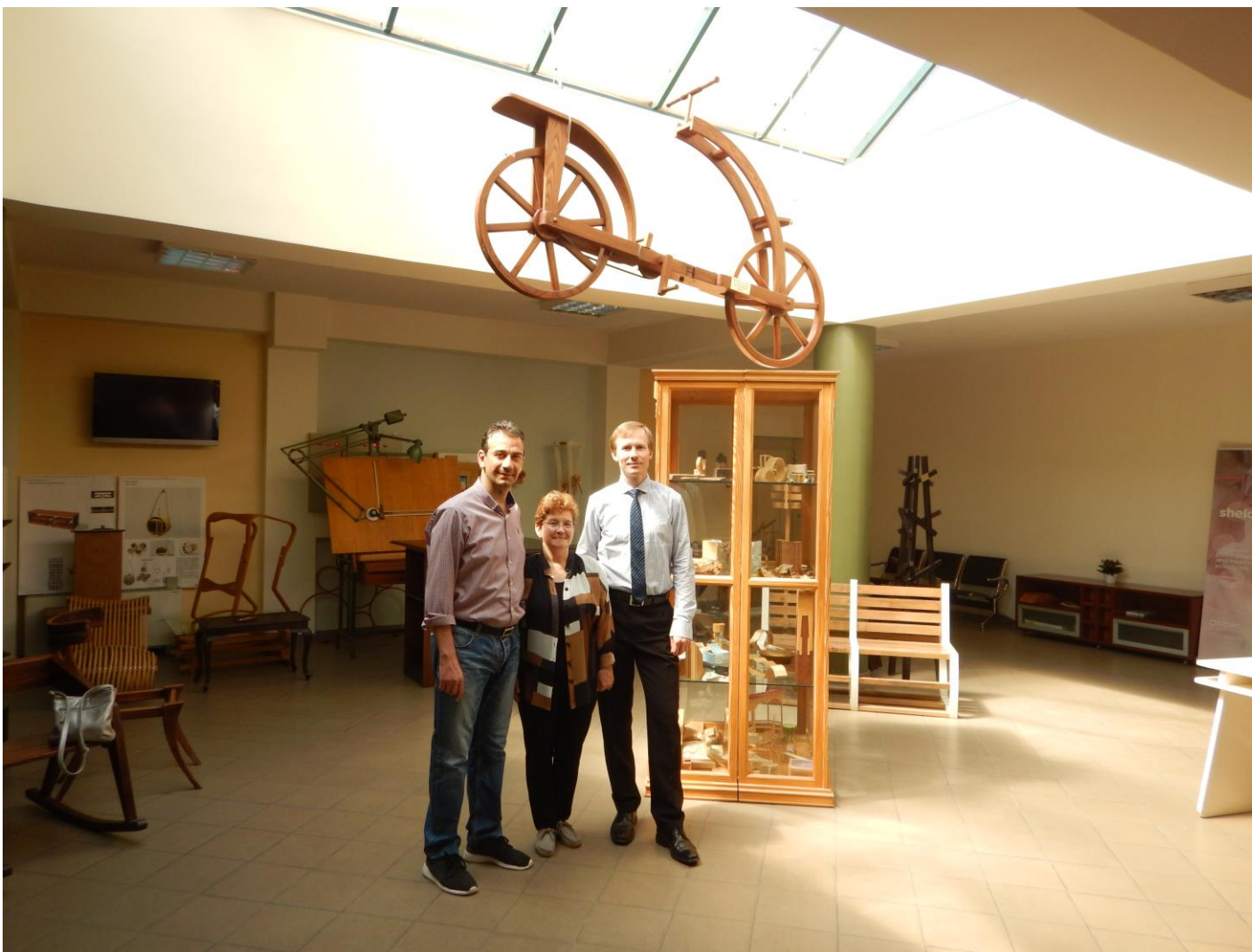
Με τους δύο ξένους συναδέλφους, σε μια αναμνηστική φωτογραφία σε κεντρικό χώρο του τμήματος ΔΕΞΥΣ.