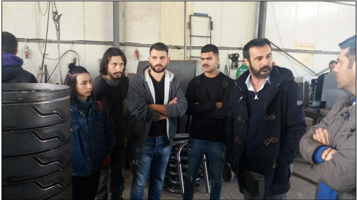
Κατά την επίσκεψη στους χώρους παραγωγής της εν λόγω εταιρείας.