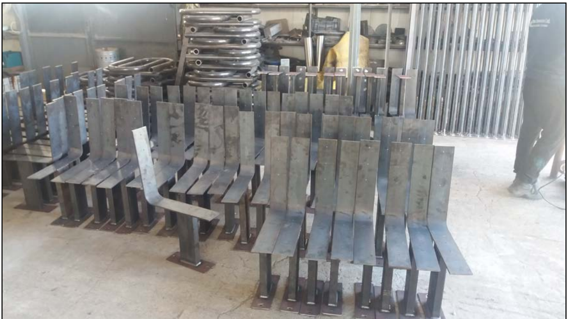
Ημιτελείς μεταλλικές βάσεις – πριν από το τελικό φινίρισμα.