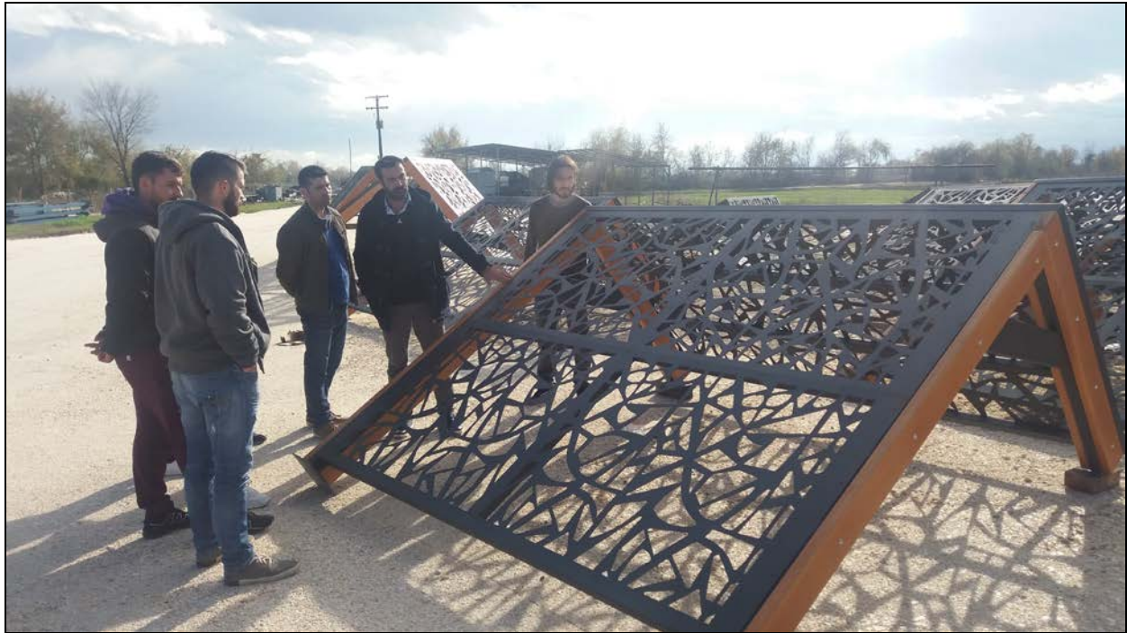
Φωτογραφία κατά την εκπ/κή επίσκεψη στην Urban Innovations (επίδειξη έργου σκίαστρου).